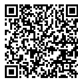
Bande son de l'expérience

On effectue l'expérience suivante: à l'aide de deux micros séparés par la distance d'une distance connue d , on enregistre le son au cours du temps. Un son est émis à la gauche du premier micro. On obtient l'enregistrement donné ci-contre: