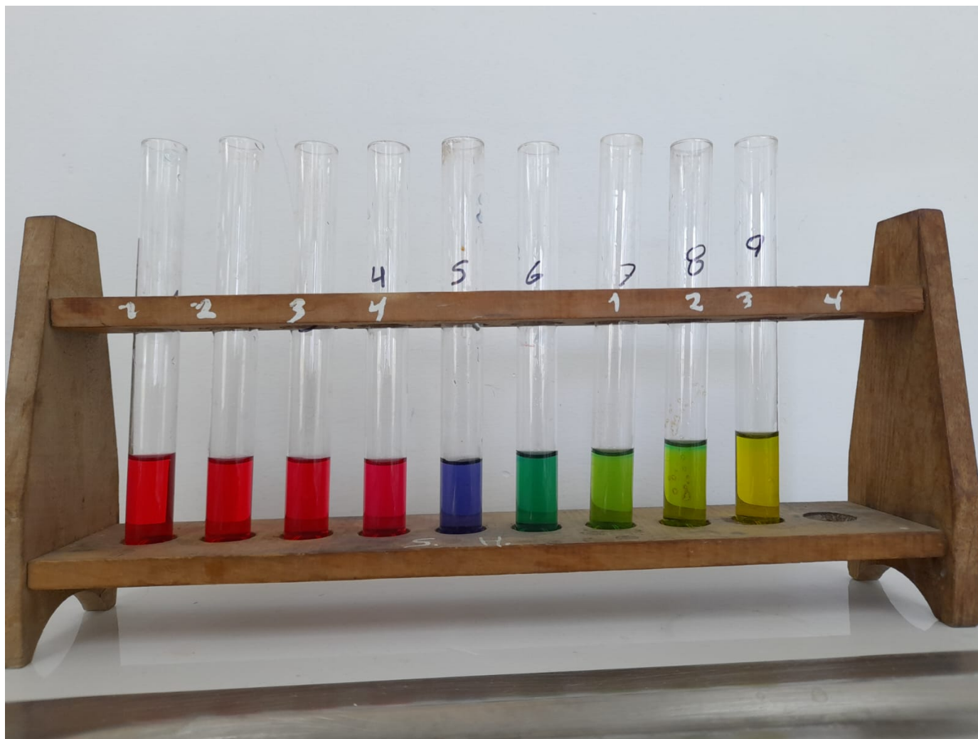
Figure 1: Échelle de pH