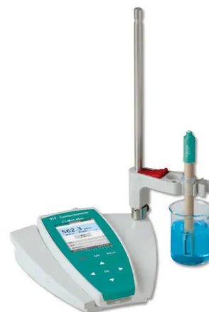
FIGURE 2 – Conductimètre de laboratoire.