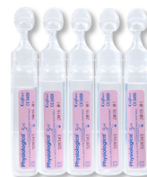
FIGURE 1 – Doses de sérum physiologique disponible en pharmacie.

Il est indiqué sur les doses fournies que le pourcentage en chlorure de sodium dans le sérum physiologique disponible est de 0,90%.